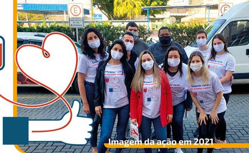
Imagem da ação em 2021

Ao todo terão 20 vagas disponíveis para cada data e não haverá custo para quem participar. O link para inscrição será divulgado nas redes sociais da Credifoz.